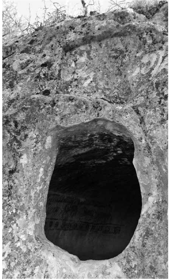
Res. 27: Sandıklı Kaya mezarının deforme olmuş kapısı ve üstündeki yazısı silinmiş yazıt levhası.