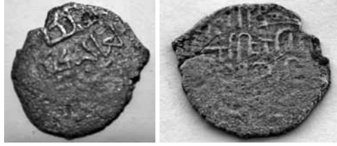
Res. 11: Selçuklu parası, ön ve arka yüz.

gömdükleri birkaç sütun parçasından daha söz edilmektedir. Bunun dışında birkaç yıl önce bir mezar kazarken, korktukları için kapattıkları bir kocaman odadan (mekân boşluğundan) söz edilmektedir. Kâzım Dede'nin bağının kenarındaki içi taş-toprak dolu kaya sarnıcı ve Serikli Hasan'ın Bağ'ının başındaki kaya mezarının yakınında bulunan kule ve sur temel kalıntısını da unutmamak gerekir (Res. 15-16). Bunlardan başka 19.yy.ın ikinci çeyreğinde köy içinde Çorlu Mehmet ve Koca Dede'nin evlerinin temeli kazılırken, birbirine yakın iki ayrı yerde ortaya çıkarılan; birincisi 350-400 kg.tahıl kapasiteli, üzerinde iki yılan sarmalanmış; ağız çapı 0,51m, karın çapı 1,00m ve yükseklik 1,22m ölçülerinde büyük bir Roma pithos'u (erzak küpü). Diğeri ise içi sırlı, ağız çapı 0,36m, karın çapı 0,76m ve yüksekliği 1,00m ölçülerinde ve üzerinde iki haç arasında sahibinin adı (Araxiou-Aραξιου= Araksios'un) graffite edimiş tahminen 200 kg tahıl alabilen bir Bizans (olasıyla 6-7. yüzyıl) küpü, adı geçen müteveffa kişilerin mirasçıları tarafından kilerlerinde kullanılarak sapaşaglam korunmuştur. (Res. 17-18)