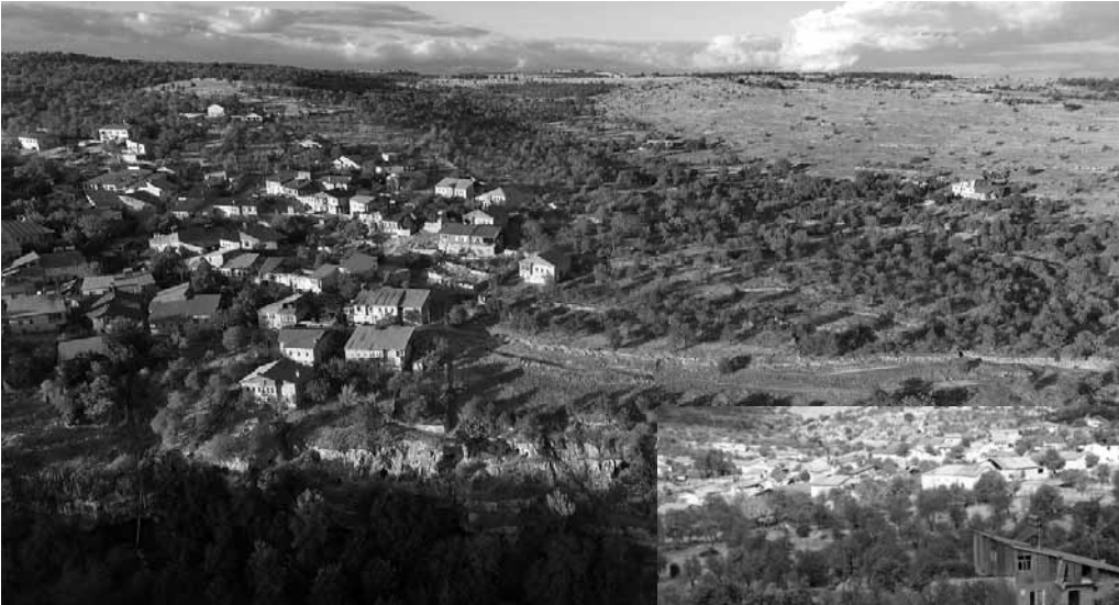
Res. 12a: Köyün doğu yarısıyla birlikte, güneyindeki kaya mezarlarının bulunduğu kayalık ve bağlık, bademlik antik alanın havadan genel görünümü.

Kaya mezar odalarından biri, büyük olasılıkla 9. yüzyıl Bizans'ın İkonoklasizm/Haçları ikonaları kırma çağında (717-867) 40-50 kişi alacak kadar genişletilerek toplanma-ibadet yeri olarak kullanılmış. En gizli köşesine derince kayaya kazınmış yasaklı haç ve ayrıca ön taraftaki duvarda kırılmış yazıttan kalan bir sözcüğün son harflerinin biçimsel özelliği (kaligrafisi) bu dönemi işaret ediyor. Daha sonraları başka amaçlar için de kullanıldığı anlaşılıyor (Res. 20). Buraya yakın bulunan, çok az zarar görmüş arksolium kline'leri ve kemerleri sağlam kalmış bir başka kaya mezarı var. Mezar odasının girişinin karşısındaki arksolium kemerinin üstünde tabula ansata içinde boyayla yazıldığından silinmiş yazıtın birinci satırındaki ismi güçlükle çıkarabilmiştik 82'deki araştırmamızda. Harfler 1.2. yy. özelliklerini taşıyordu.