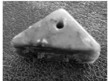
Res. 9b: Kalkolitik mühürün üçgen alınlığı ve deliği.