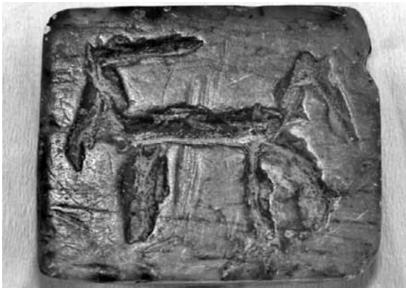
Res. 9a: Kalkolitik mühür tabanına kazınmış yaban keçisi (Foto: Nida Karaca).