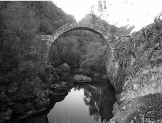
Res. 31: Arapgir Çayı üzerindeki Suçeyin Taş (Roma) Köprüsü.