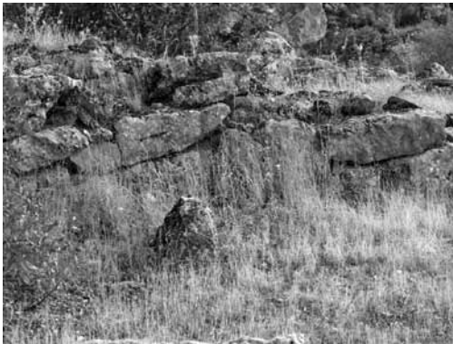
Res. 16a: (Olası) Kule duvarı kalıntısı.