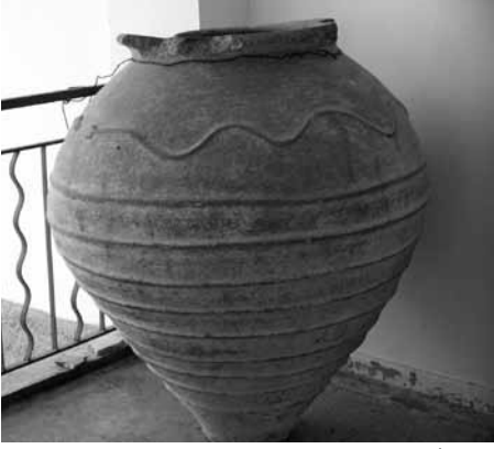
Res. 17: Roma tahıl küpü (Pithos).