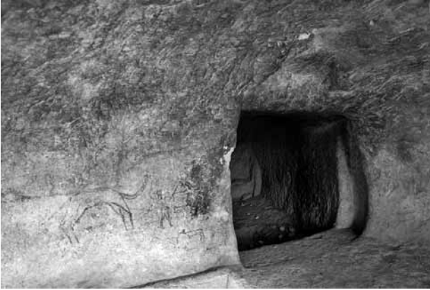
Res. 22a: Sandıklı kaya mezarının arka odası ve yanındaki figüratif deve, insan, küçükbaş hayvan ve ev resimleri.

“Sandıklı Mağara” kaya mezarı çok büyük olasıyla en geç 1. yüzyılın sonlarına tarihlenebilir diye düşünüyoruz. Sağ duvardaki atların çok canlı, hareketli, uzun boyunlu ve uzun bacaklı ve realistik görünümde oluşu; İ.Ö. 5-4. yy. Klasik Dönem’e özenen Hellenistik Dönem (İ.Ö. 3.2. yy) san’at anlayışının Erken Roma Sanatı’na yansımaları olarak değerlendirilebilir. Yaklaşık iki bin yıl önce yapılmış olan bu at resimleri, çok ödüllü bir fotoğraf sanatçısı olan Tahsin Aydoğmuş, yayınladığı 200’den fazla fotoğrafın bulunduğu büyük boy albümünde doğal hareketliliğin, Devinimin Görsel Dili (Expression of motion) olarak en başta yer verilmiştir. (Res. Değerli sanatçı atların hareketliliğini betimleyen bu resimler için şöyle söylemektedir: