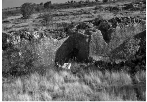
Res. 15: (Olası) Sur kaya temel kalıntısı.