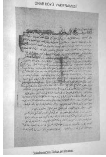
Res. 34: 1224 tarihli Onar Zaviyesine verilmiş olan Vakıfname 'nin kopyası.

ye vakfedilmiş arazinin sınırlarını ve kullanım koşullarını belirleyen Vakıfname 'yle kuruma resmiyet kazandırmıştır (Res.34). Bu Onar Zaviyesi kurumunun bir parçası olan Büyükocak ve Şeyh Bahşiş Tekkeleri cemevi işlevi görerek, zamanımıza kadar korunmuş ve Türkiye'de bilinen en eski Cemevleri olarak yaşamaktadır (Res. 35).