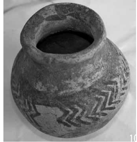
Res. 7: Kalkolitik ritüel çömleği (Foto: İsmail Kaygusuz).

Onar köyünün doğu ve güneydoğusundaki Pektarla, Tolikosman, Köysayı, Osmanın Bağının Başı ve Kalaycık semtlerini kapsayan bağ-bahçe, tarla ve bademlik alanlarında (Res. 12a-b) 1982 yılı yüzey araştırmalarımız sırasında birkaç Kalkolitik Çağ keramiğiyle birlikte çok sayıda Hellenistik, Terra sigillata/erken Roma, geç Roma ve Bizans keramikleri bulmuştuk. Bu alanlarda yığınlar halinde devasa taş duvarlarla bağların tarlaların birbirlerinden ayrılmış olması (Res. 13), bir antik harabenin üzerinde bulunduğunu açıkça göstermesi dışında; köylülerin üzüm çığneme aracı (salk) yaptıkları bir çapı 0,98 m, yüksekliği 0,60 m. olan bir sütun kasnağı (Res. 14); ayrıca bağ yaparken ortaya çıkan ve tekrar toprağa