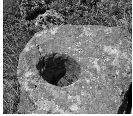
Res. 6: Taş levha üzerinde tek sunu çanağı (Foto: İsmail Kaygusuz).

dan uzunlamasına açılmış ince bir delik bulunmakta. Bu onun boyun asılı olarak taşındığını gösteriyor. Kalkolitik mühürü bağ kazarken bulan Mehmet Ünlü'nün dediğine göre, aynı bağın farklı yerlerinde ve değişik tarihlerde 3. yüzyıla ait bir Roma (İmp. Titus Fulvius Quietus İ.S. 261) ve bir Selçuklu Sultanı (13. yüzyıl) sikkesi bulmuştur (Res. 10-11). Birbirinden binlerce yıl uzak olan üç ayrı çağa ait buluntuların bir dönüm bile olmayan bir üzüm bağı alanında bulunması, ilginç olduğu kadar da bölgede prehistorik dönemlerden itibaren kesintisiz yerleşimin kanıtları olarak görmek gerekmez mi?