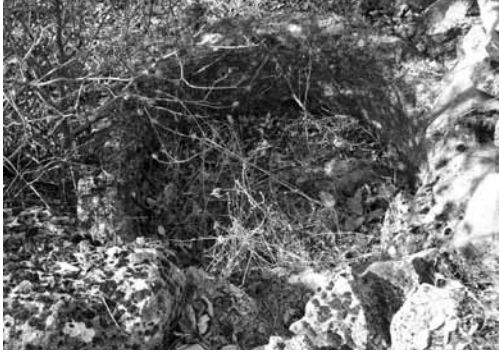
Res. 14b: Antik alanda oyulmuş sütun kasmağının üstten görünüşü, çapı: 0,98 m.