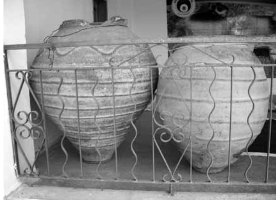
Res. 18a: Roma ve Bizans (sağda) pithos'ları birarada.