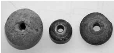
Res. 3: Ağırşaklar ve taş boncuk.