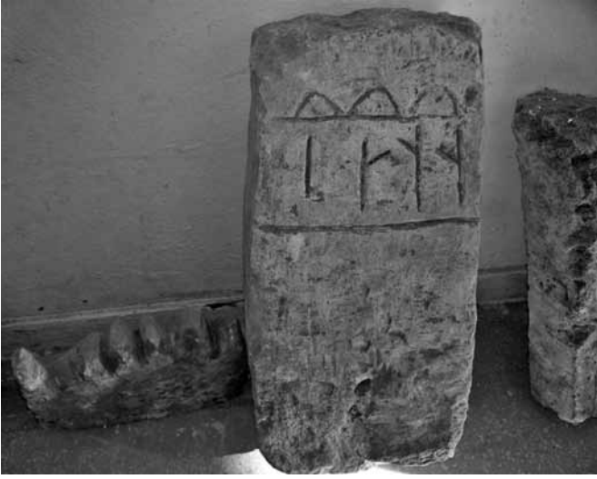
Res. 33: Göktürk alfabesi harfleriyle Bayat boy damgası: “Neng ölesi (Herşey fanidir)”.