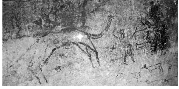
Res. 26a: Sandıklı mağara duvarındaki stilize deve, insan, ev ve küçükbaş hayvan resimleri (Foto: Kasım Gümüş).

“2012 yılında Arapgir’in Onar köyündeki kaya mezarlarının bulunduğu bölgeye gittik. Kaya mezarlarının birinde inanılmaz çizimleriyle altı ayrı devinimi anlatan at figürlerini görünce çok şaşırđım. Figürleri incelediğimde o dönem insanların atların hareketlerini görsel dile dönüştürdüklerini hayretle gözlemlerdim. Yüzyıllar öncesinde de günümüzde de atların devinimleri görsel dille özgürlüğün sembolü olarak kullanılmagelmiştir...” 4