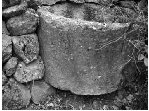
Res. 14a: Antik alanda bulunan oyulmuş sütun kasmağı, yükseklik: 0,6 m.