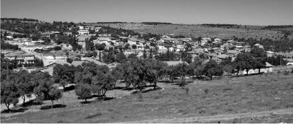
Res. 1: Anar Köyü'nün güneybatıdan görünümü (Foto: İsmail Kaygusuz).