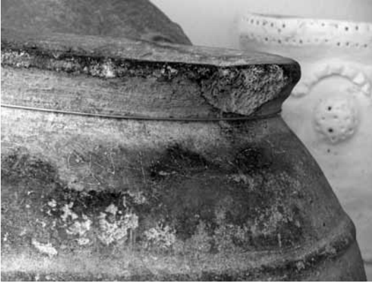
Res. 18b: Bizans küpü üzerindeki yazıt: Αραξιου = Araksios (Araksios'un küpü).

küçük odalı-olasıyla ikincisi sonradan eklenmiş- ve köylülerin "Sandıklı Mağara" adı takmış oldukları kaya mezarıdır.