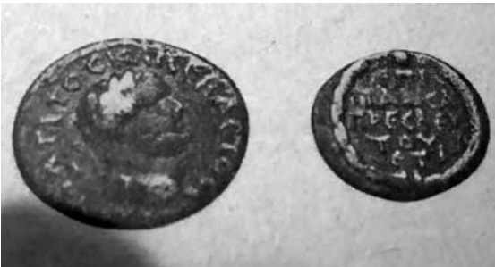
Res. 32: Titus Fl. Vespasianus parası, İ.S. 70.

nu düşünmüyoruz; İmp. Vespasianus'un burasıyla özel bir ilişkisi vardır ve XII. Fulminata Lejyonu'nu burada konuşlandırmış; lejyonerlerin ücretleri de eyalette basılan paralarla ödenmiştir anlamı çıkmaz mı?