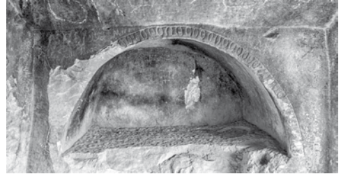
Res. 21a: Yumurta frizli arkosolium kimeri (Foto: Kasım Gümüş).