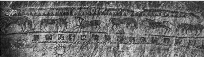
Res. 24a: Sandıklı Mağaradaki koşan ve otlayan atlar freski (Tahsin Aydoğmuş'un kitabından) (Foto: Tahsin Aydoğmuş).