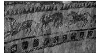
Res. 24b: Koşan ve otlayan atlar freskinden bir detay.