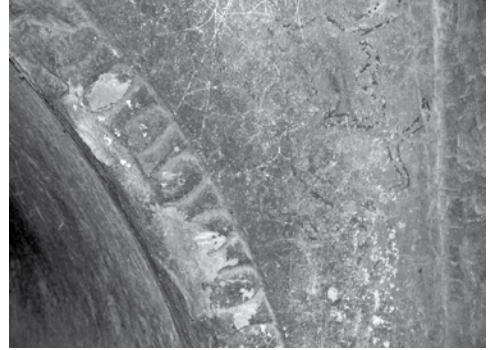
Res. 21b: Yumurta frizinin sağındaki yılan resimleri.