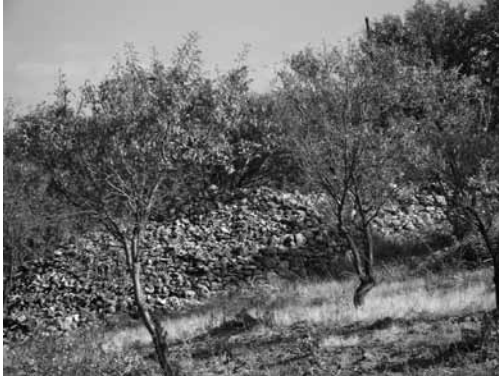
Res. 13a: Bademlik antik alandan duvar kalıntıları (Foto: İsmail Kaygusuz).