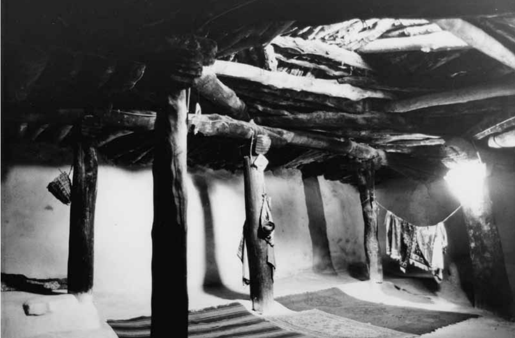
Res. 35a: Tarihi Büyük Ocak Cemevi'nde Karadirek ve Murat Direği, Yapılış Yılı: Hicri 621 (M.1224) (Foto: Nezih Başgelen, 1983).

Bugün açık ve kapalı durumda 20 kadar kaya mezarını kapsayan nekropol alanı olasılıkla İ.Ö. 1. yüzyıldan 9. yüzyıllara kadar kullanılmıştır. Yaptığımız yüzey araştırmalarında ele geçen arkeolojik malzemeler, köyün arazisinde İlk Neolithik'den, yani İ.Ö. 7. binden bu yana 9 bin yıllık kesintisiz yerleşme bulunduğunu göstermektedir. Belki de, Şeyh Hasan Onar buraya gel-