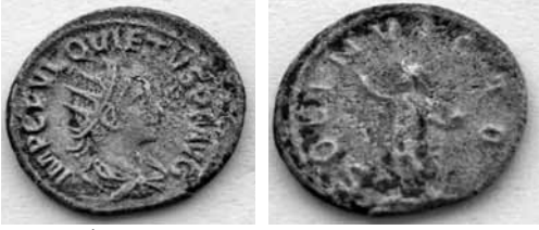
Res. 10: İmp. Titus F. Quietus sikkesi, ön ve arka yüz.