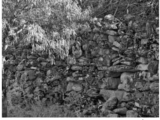
Res. 13b: Antik alandan duvar kalıntıları.