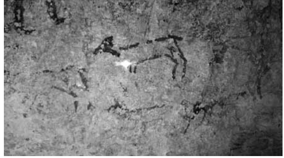
Res. 26b: Küçükbaş hayvanlar ve çobanı (?).

Kaya mezarının duvarlarındaki bu resimler ne anlama geliyor, neyi ifade ediyordu? Daha sonraki yüzyıllarda birçok kere kullanıldığına göre, bu mezarın ilk sahibi kimdi? Her kimse, bu resimler tamamıyla onunla ilgilidir. İlk bakışta bu mezar sahibinin atlarla yakından ilişkisi olduğu izlenimi zaten uyandırıyor. Ama, herhalde at bakıcısı, sıradan bir seyis değildi. Ayrıca karşı duvardaki at üstünde süvari resmi, bu kişinin, yani ilk mezar sahibinin bir süvari olduğunu göstermekte olduğu kuşkuların ötesindedir. Hemen kim olabileceği hakkında düşündüğümüzü baştan, çekinmeden söyleyelim: Bu kişi bir Roma lejyonu süvarisidir. Hem de sıradan bir asker değil, lejyonda çeşitli hizmetlerde bulunmuş, birçok aşamalardan geçmiş bir