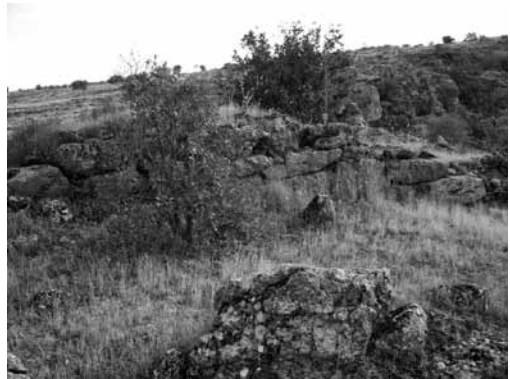
Res. 16b: (Olası) Kule duvarı kalıntısı (Foto: İsmail Kaygusuz).