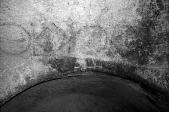
Res. 29: Çifte kaya mezarının arcosolium kemeri üzerindeki geometrik şekiller.