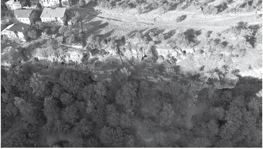
Res. 19b: Kaya mezarlarının bulunduğu kayalık alanın havadan genel görünümü.