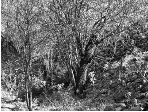
Res. 13c: Bademlik antik alandan duvar kalıntıları.