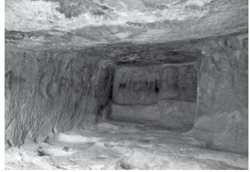
Res. 20: Kaya mezarından bozulmuş büyük mağaranın içten görünüşü (Foto: İsmail Kaygusuz).

At resimlerinin karşısındaki sağ duvarda sadece at binmiş koşturan, sol kolunu geriye doğru uzatmış, sağ eli atın dizgininde, ve sanki yüzüne doğru dalgalanan bir sancak (!) bulunan