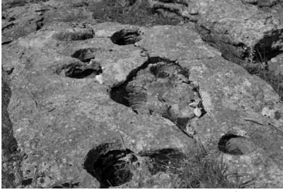
Res. 5: Tek taş levha üzerinde sunu çanakları.