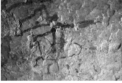
Res. 25: Sandıklı Mağara duvarında at koşuturan süvari.