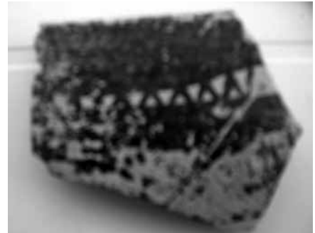
Res. 8: Kalkolitik keramik parçası.