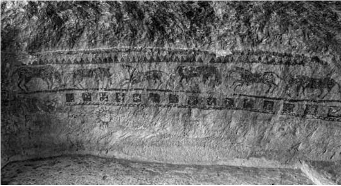
Res. 23: Sandıklı mağaranın duvarındaki güneş, koşan-otlayan atlar, kare ve üçgen bordürlü kompozisyon.