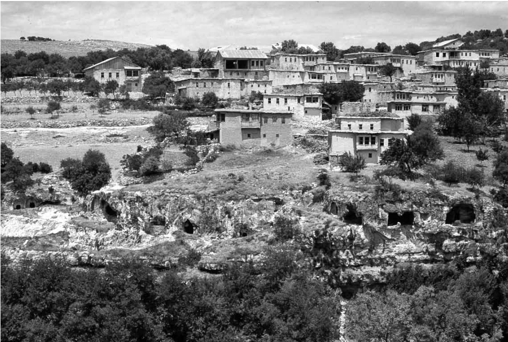
Res. 19a: Kaya mezarlarının bulunduğu alanın batı bölümü (Foto: Nezih Başgelen, 1983).

Malatya İnönü Üniversitesi'nden Yrd. Doç. Recep Özman tarafından incelenmiş Onar Kaya Mezarlarının büyük çoğunluğu çok küçük farklarla aynı tipolojik yapı özelliği taşımakta; mezar girişinin karşısında ve iki yanında arkosolium'lar bulunmakta ve mezar odasının ortasında bir veya iki ceset teknesi açılmış durumda. Mezarlardan birinin kemerlerinin kenarı firdolayı oyma yöntemiyle köşeli menderes ve yumurta friziyle süslenmiş ve bunun sağ yanında kırmızı boyayla birkaç yılan motifi bulunmakta (Res. 21). Bu motiflerin çizildiği arkosolium'da bir hekimin cesedi bulunduğu düşünülebilir. İçlerinde hepsinden farklı tipolojik özellik gösteren; içiçe iki