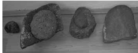
Res. 4: Toplu Neolitik aletler.