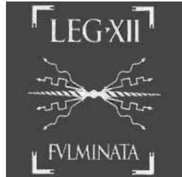
Res. 28: XII. Fulminata Lejyonu'nun arması

Flavius Iosephus'un (F. Iosephus, Belli Iudeae , 7, 1.3) “Titus'un bu lejyonu, daha önce yahudilere yenildiğini anımsatarak Melitene'ye gönderdiğini yazması” inandırıcı olamaz. Çünkü, XII. Fulminata Lejyonuna komuta ederken Yahudi savaşlarında başarı kazandı. İmparatorluk için isyan ettiğinde bu lejyon kendi tarafında olmuştur. Kısacası cezalandırılacak bir durum yoktu ki, sürgüne göndermiş olsun! Tam tersine, gücünü önemseyerek orada, Armenia sınırını korusunlar diye görevlendiriyor. Yani, aynı antik yazarın kendi söylemiyle “Armenia ve Kappadokya sınırlarında, Fırat'a