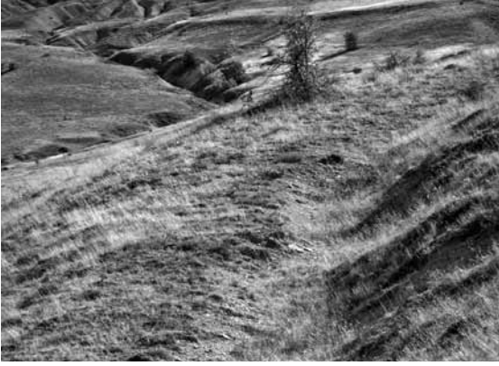
Res. 30: Kızılyazı semtindeki antik yol kalıntısı.