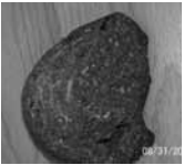
Res. 2: Yarım çekic başı.